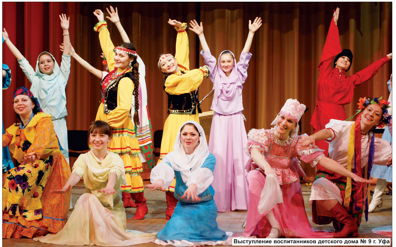
Выступление воспитанников детского дома № 9 г. Уфа

Тот факт, что на благотвори- тельный вечер пришли высокие гости - заместитель Премьер-ми- нистра Правительства Респуб- лики Башкортостан Зугура Рах- матуллина и председатель Совета по государственно-межконфесси- ональным отношениям при Пре- зиденте РБ Вячеслав Пятков, за- меститель председателя Духов- ного управления мусульман РБ Аюп Бибарсов, государственные, религиозные и общественные де- ятели республики и Уфы, меце- наты свидетельствует о большом значении проведенного меропри- ятия, формирующего гуманное отношение и добрые инициативы в отношении воспитания и судеб подростающего поколения, ли- шенного родителей.